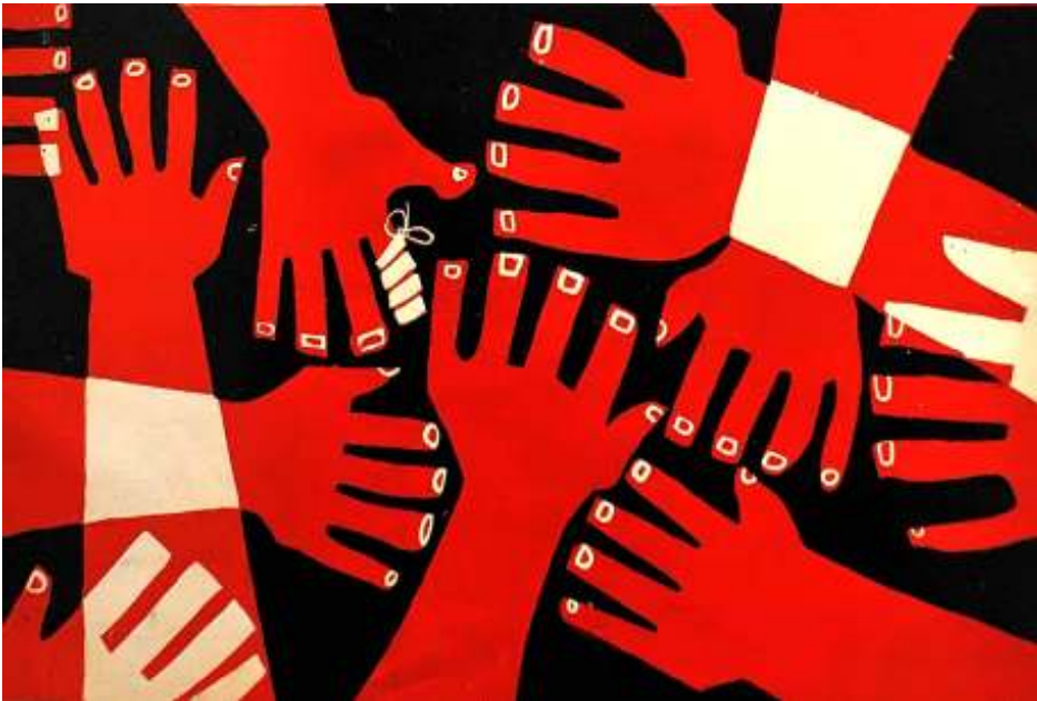
ဖမာနိုင်ငံလုံးဆိုင်ရာ ကျောင်းသားသမဂ္ဂများ အဖွဲ့ချုပ်မှ ထုတ်ဝေသည်။

စစ်တပ်ဟာ သူတို့ကို ဆန့်ကျင်အာခံလာတဲ့သူတွေကို လက်နက်ကိုင် လက်နက်မဲ့ ကိုယ့်တိုင်းရင်း သားတွေ ကိုယ့်နိုင်ငံသားတွေ တိုင်းတပါးသားတွေ စသဖြင့် ခွဲခြားမကြည့်ပါဘူး။ လူငယ်လူကြီး ခွဲခြား မကြည့်ပါဘူး။ အားလုံးကို ရန်သူလို့ တသဘောတည်းထားပြီး စစ်ပွဲတခုလို ပြင်ဆင် စစ်ဆင်ပြီး ဘယ်လိုနည်းနဲ့