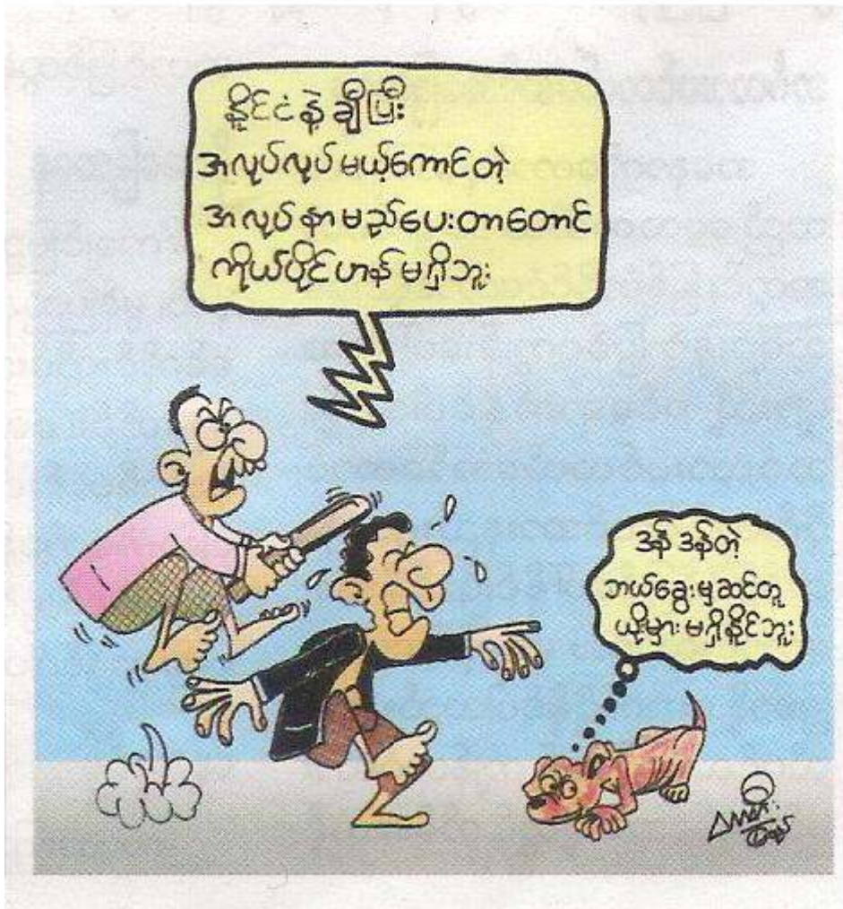
(မေလ ၂၈၊ ၂၀၁၀ ခုနှစ်(သောကြာနေ့)ထုတ် အမှတ်(၂၀၉) မော်ဒန်ဂျာနယ်မှ ကာတွန်းအား ပြန်လည်ကူးယူဖော်ပြပါသည်။)

ဗမာနိုင်ငံလုံးဆိုင်ရာ ကျောင်းသားသမဂ္ဂများ အဖွဲ့ချုပ်မှ ထုတ်ဝေသည်။