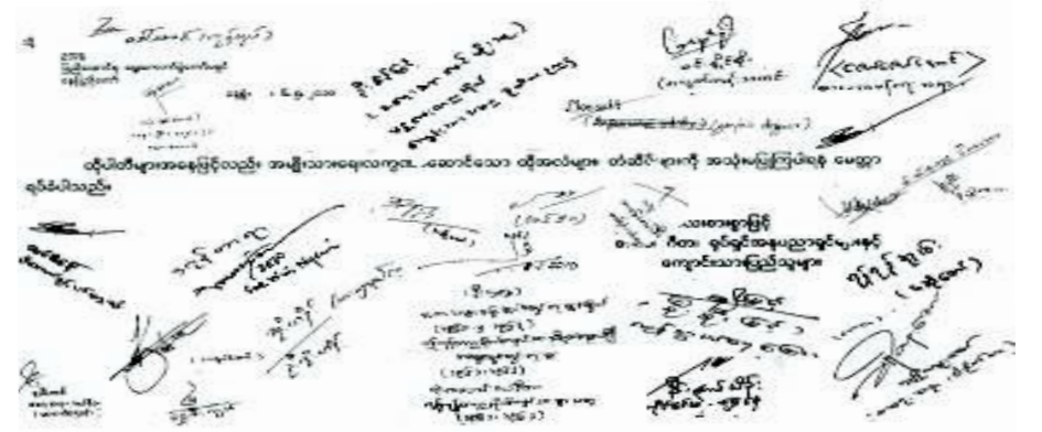
ဗမာနိုင်ငံလုံးဆိုင်ရာ ကျောင်းသားသမဂ္ဂများ အဖွဲ့ချုပ်မှ ထုတ်ဝေသည်။